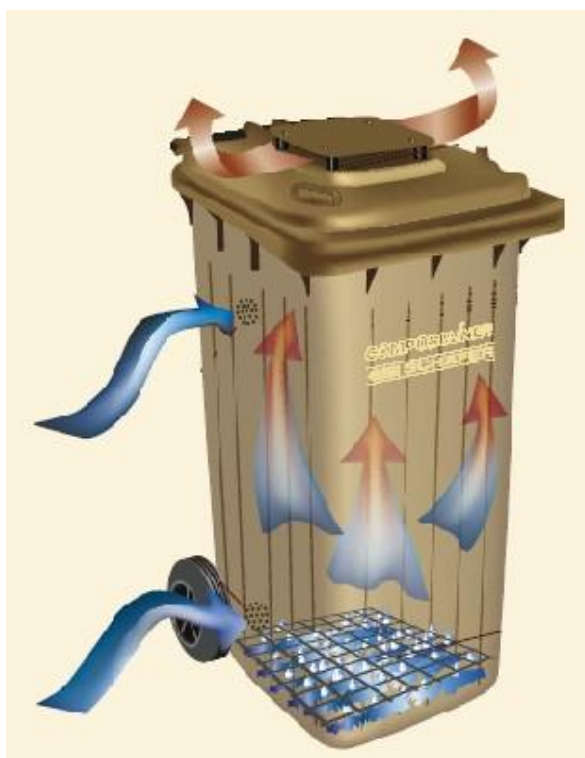
Rysunek 2 Pojemnik do kompostu SSI SCHAFFER - CT-120L

Poniżej przedstawiono przykładowy kompostownik z tworzyw sztucznych. Cena urządzeń zależy od przyjętego rozwiązania i waha się od kilkudziesięciu złotych do ponad tysiąca złotych