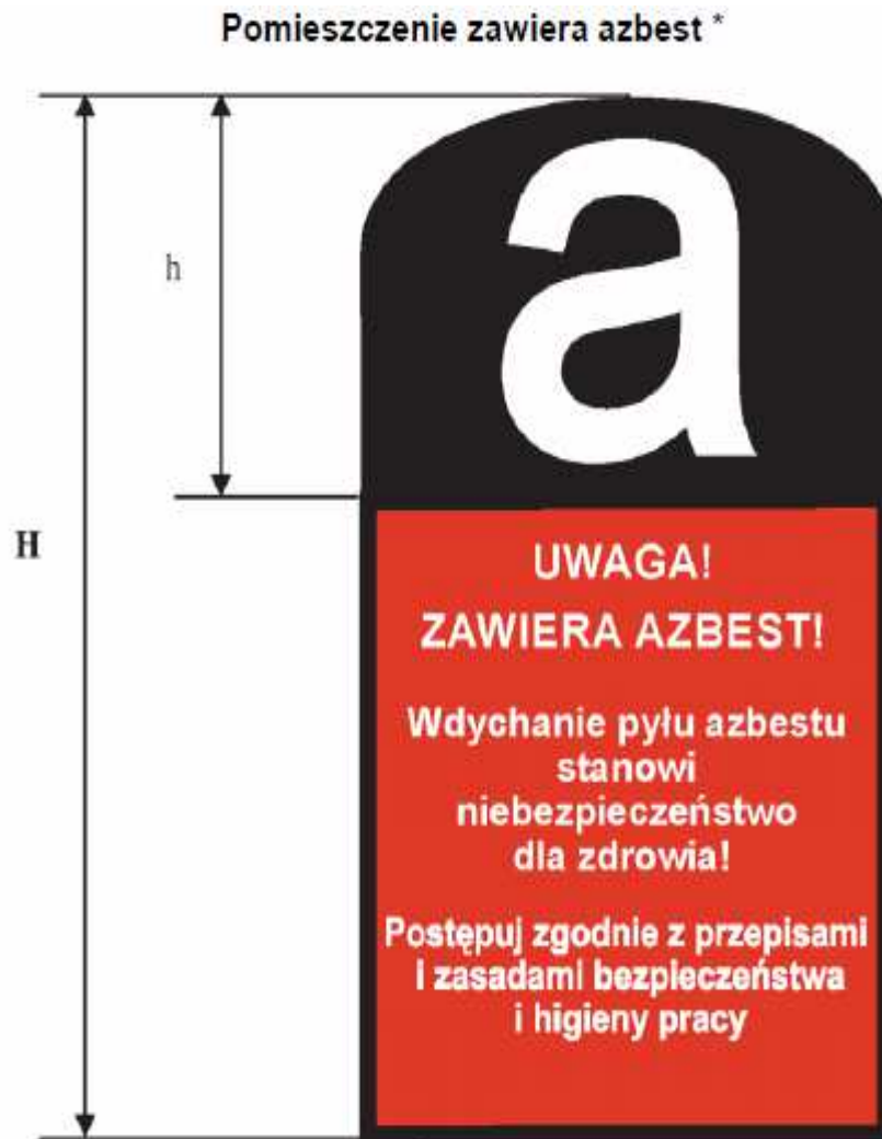
Rysunek 1 Graficzny wzór oznakowania azbestu i wyrobów zawierających azbest

Prace związane z usuwaniem wyrobów zawierających azbest prowadzi się w sposób uniemożliwiający emisję azbestu do środowiska oraz powodujący zminimalizowanie pylenia poprzez: