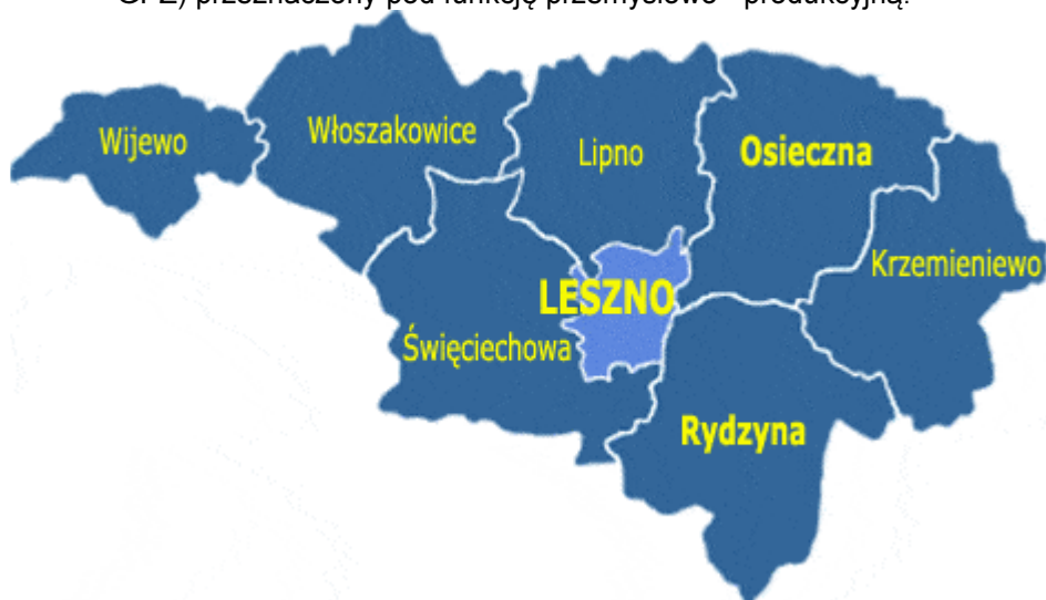
Rysunek 3 Położenie Gminy Lipno na tle Powiatu Leszczyńskiego