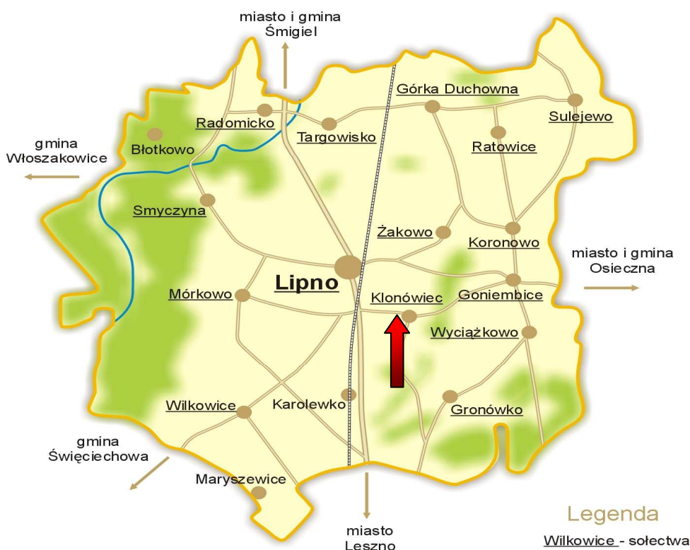
Rysunek 1. Położenie miejscowości Klonówiec w Gminie Lipno

Położenie miejscowości Klonówiec w Gminie Lipno przedstawia Rysunek 1.