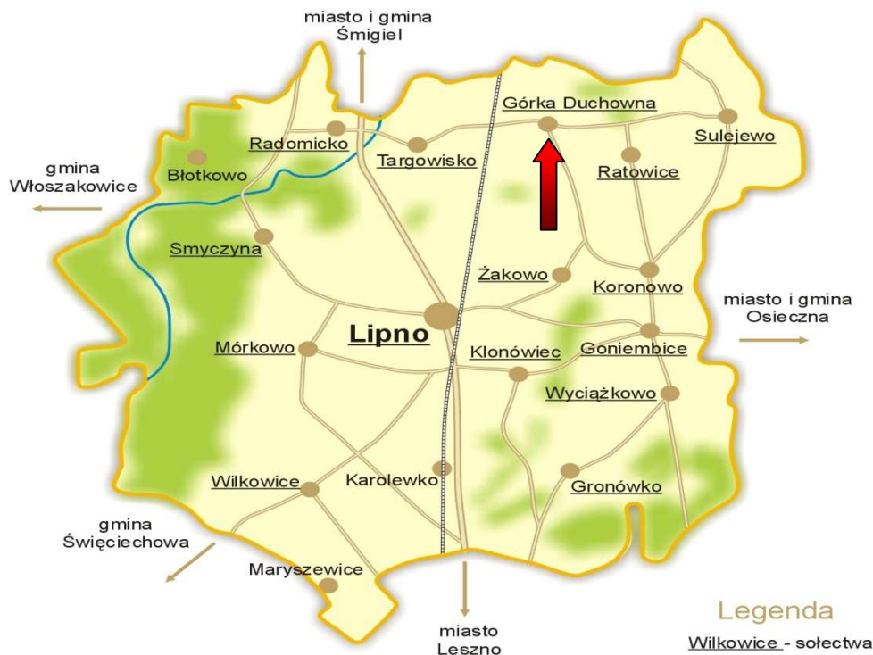
Rysunek 1. Położenie miejscowości Górka Duchowna w Gminie Lipno

Położenie miejscowości Górka Duchowna w Gminie Lipno przedstawia Rysunek 1.