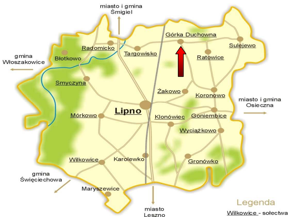
Rysunek 1. Położenie miejscowości Górka Duchowna w Gminie Lipno

Położenie miejscowości Górka Duchowna w Gminie Lipno przedstawia Rysunek 1.