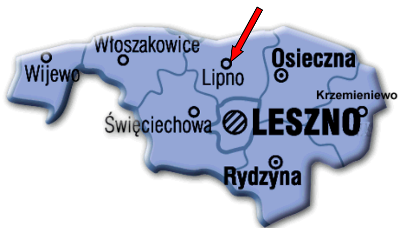
Rycina 1. Gmina Lipno na tle powiatu leszczyńskiego.

Wiejska Gmina Lipno jest jedną z siedmiu jednostek samorządu terytorialnego wchodzącego w skład powiatu leszczyńskiego (rycina 1.). Do gminy, oprócz Lipna, należy czternaście sołectw: Goniembice, Górka Duchowna, Gronówko, Klonówiec, Koronowo, Mórkowo, Radomicko, Ratowice, Smyczyna, Sulejewo, Targowisko, Wilkowice, Wyciążkowo i Żakowo. Od północy gmina Lipno graniczy z gminą Śmigiel, od wschodu – z gminą Osieczna, od południa – z gminą Leszno, od południowego zachodu – z gminą Święciechowa, a od zachodu – z gminą Włoszakowice.