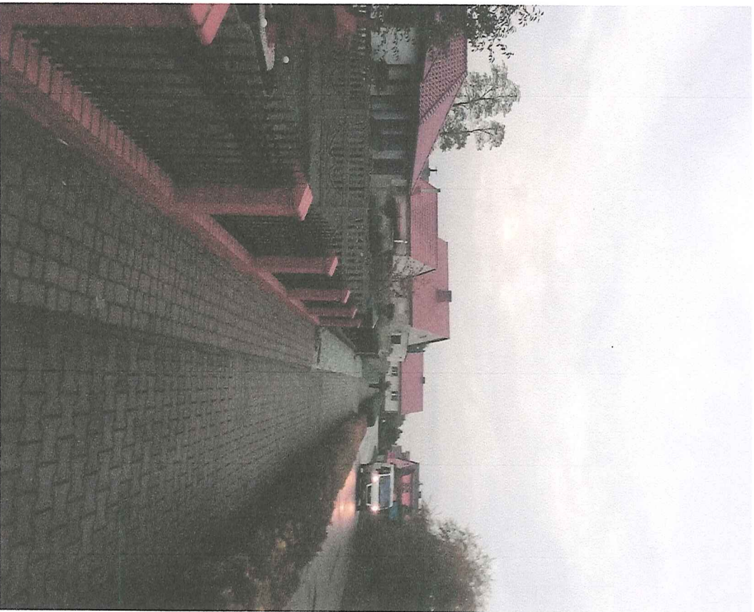
Załącznik nr 1