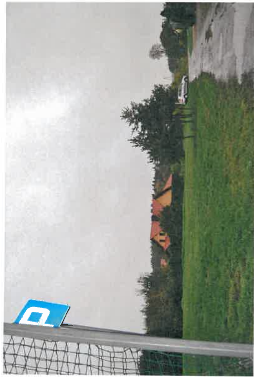
Teren zielony do zagospodarowania pod park wiejski