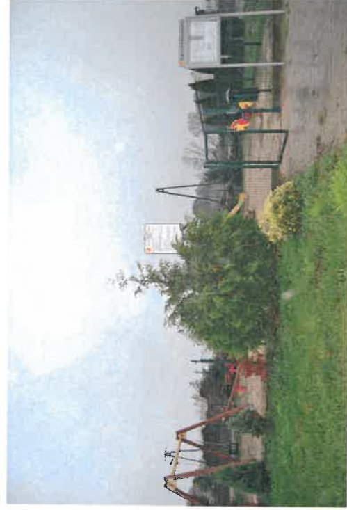
Plac zabaw w Koronowie