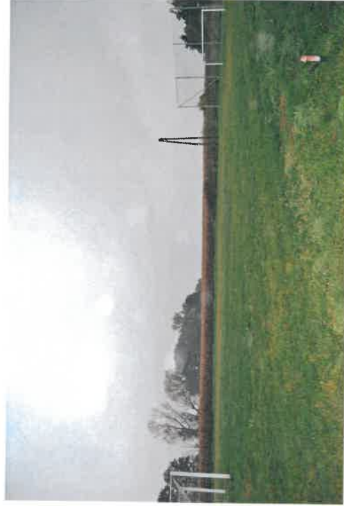
Boisko sportowe w Koronowie