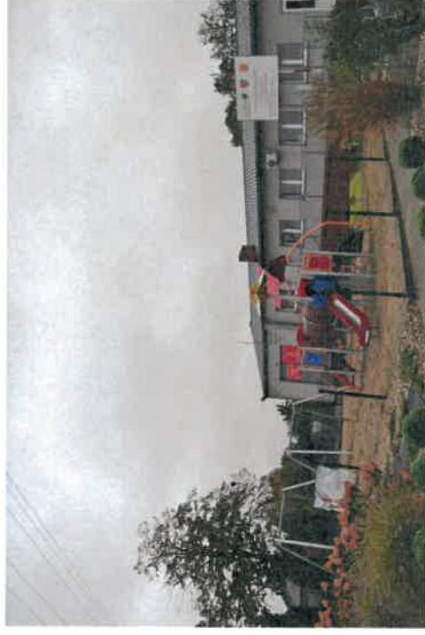
Plac zabaw w Radomicku