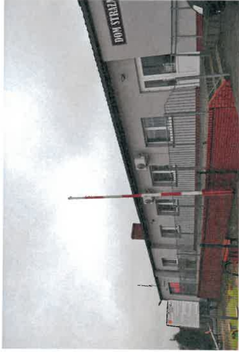
Świetlica wiejska w Radomicku