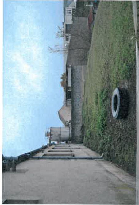
Teren za świetlicą wiejską