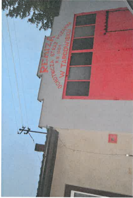
Remiza OSP Targowisko