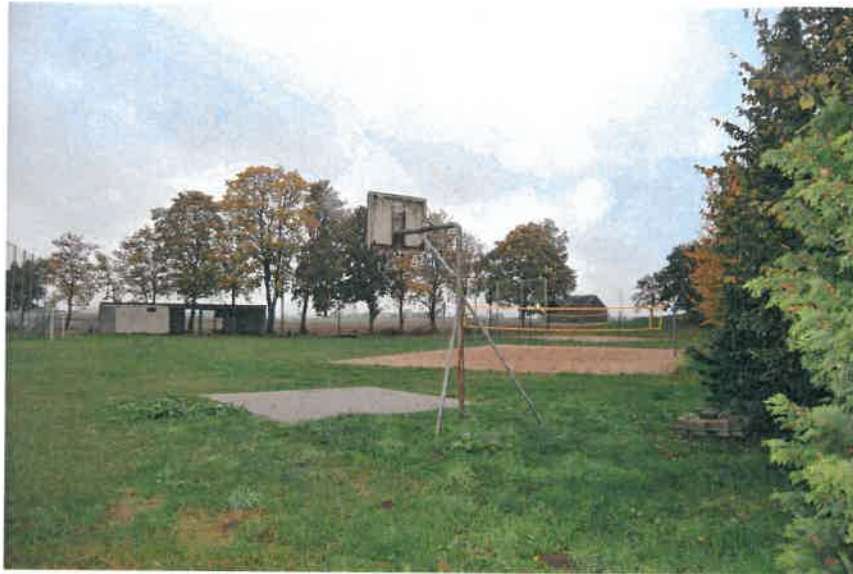
Teren rekreacyjny - sportowy